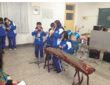
参赛选手精湛的技巧也让在场评分老师赞叹不已。

静静聆听生命, 那是对青春最热情的召唤, 对生活最真实的演绎, 对生命最真实的赞美。至此, 我校第六届艺术节乐器比赛圆满结